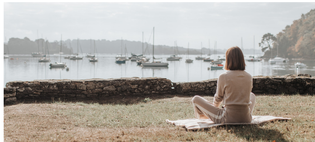
Les bords de Rance - Montmarin - Pleurtuit

Le Minihic-sur-Rance est une destination simple, humaine et réconfortante. Douceur et sérénité sont les maître-mots de ce village.