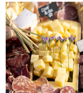
BLEU ET CRÈME

3, place Guy Betaux 06 84 50 30 44 fromagerielannseoc@gmail.com Ouvert toute l'année du mardi au samedi.