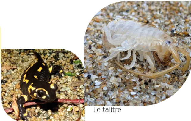
La salamandre tachetée